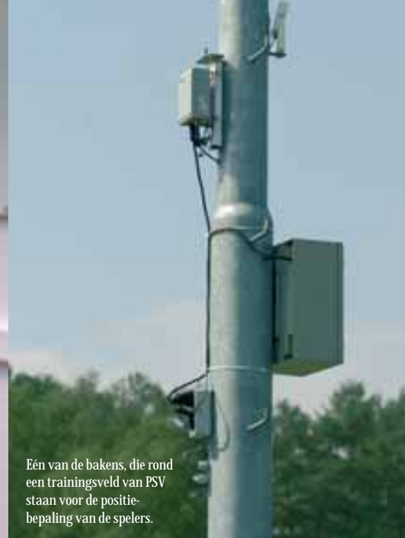
Eén van de bakens, die rond een trainingsveld van PSV staan voor de positiebepaling van de spelers.

je alle spelsituaties terugzien waarbij de verdediger dicht bij de spits is dan vier meter? Dat wordt nu heel eenvoudig.'