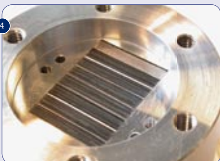
Fig. 6 Impressie van een 'rotating chemical plant' voor een katalytische meerstapssynthese in 'multiple spinning disks' reactoren (bron: TU/e)

Fig. 5 Prototype van een 'multiple spinning disks reactor' voor onderzoekdoelinden (bron: TU/e)