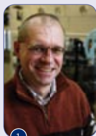
1 Fig. 1 Prof.dr.ir. Jaap Schouten

Microreactoren zijn onder meer geschikt voor het maken van fijnchemische of farmaceutische producten. Daarbij vindt over het algemeen een synthese van complexe organische moleculen plaats. In een traditioneel groot reactorvat heb je te maken met een flinke spreiding op de verblijftijd van de stoffen en daardoor is het gemaakte product vaak niet voldoende, in een microreactor kun je de synthese veel gecontroleerder laten plaatsvinden. In de microkanalen is er een zogeheten